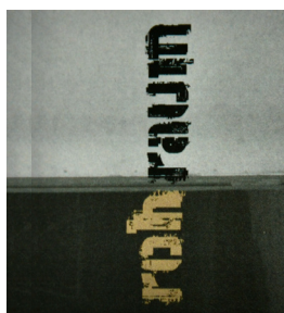
rohraum Neschwilerstrasse 19 8486 Rikon

Samstag und Sonntag 02/03–09/10–16/17. Mai: 14.00–17.00 Uhr, Donnerstag 07/14. Mai: 10.00–12.00 und 14.00–17.00 Uhr